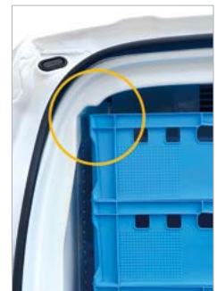
Formenbau optimale Raumnutzung