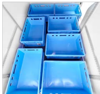
Heckeinsicht maximale Grundbeladung mit E2-Kisten

Die Angaben sind verbleibende Maße nach erfolgtem Isolierausbau.