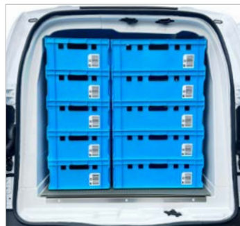
Heckeinsicht maximale Beladung mit E2-Kisten