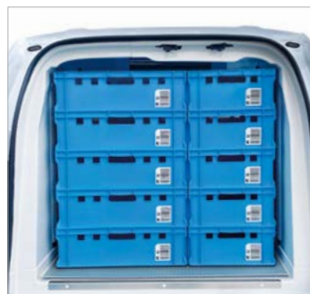
Heckeinsicht maximale Beladung mit E2-Kisten