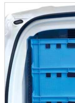
Formenbau optimale Raumnutzung