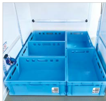
Heckeinsicht maximale Grundbeladung mit E2-Kisten