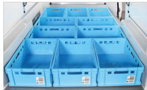
Heckeinsicht - maximale Grundbeladung

Die Angaben sind verbleibende Maße nach erfolgtem Isolierausbau.