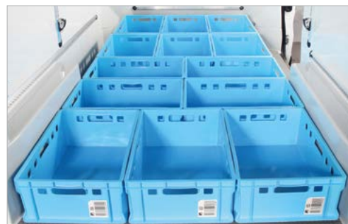
Heckeinsicht - maximale Grundbeladung

Die Angaben sind verbleibende Maße nach erfolgtem Isolierausbau.