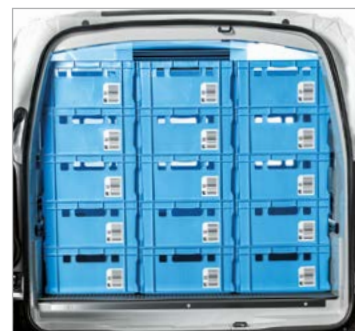
Heckeneinsicht maximale Beladung