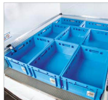
Heckeneinsicht Grundbeladung E2-Kisten

Die Angaben sind verbleibende Maße nach erfolgtem Isolierausbau.