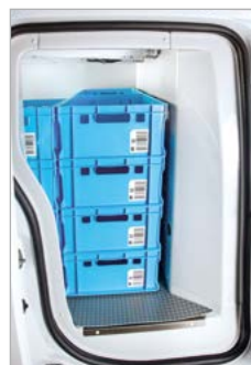
Seiteneinsicht maximale Beladung