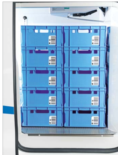
Seiteneinsicht maximale Beladung (mit Verdampfer)

Die Angaben sind verbleibende Maße nach erfolgtem Isolierausbau.