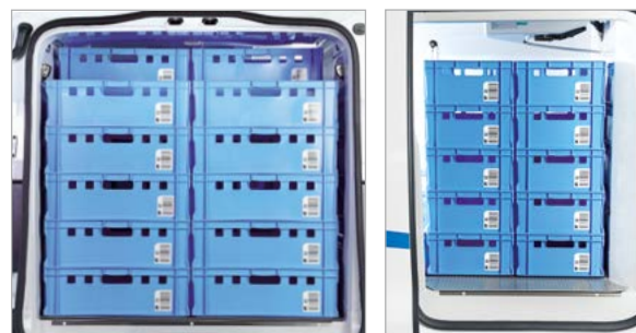
Heckeinsicht maximale Beladung