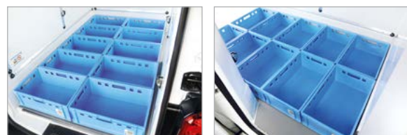
Heckeinsicht Grundbeladung E2-Kisten